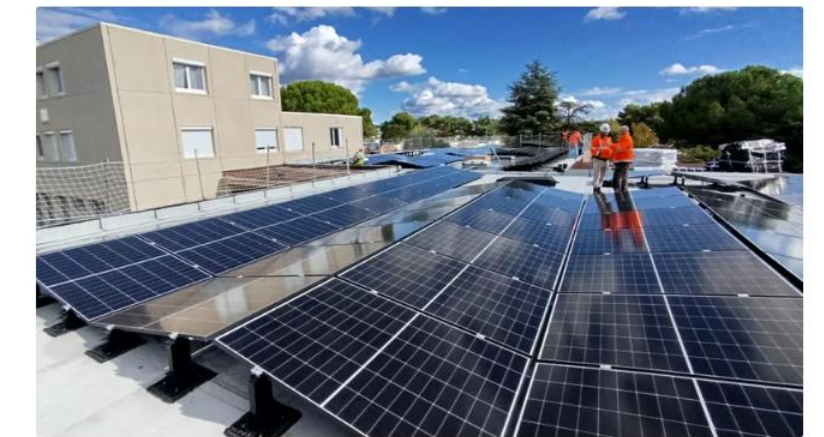
Dans le cadre du projet Notre énergie Vitrolles, des panneaux solaires ont été notamment installés sur le groupe scolaire Plan de la Cour.