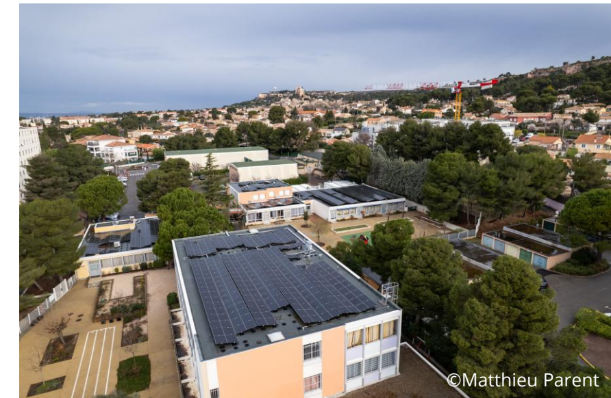
Groupe scolaire Prairial

Site rénové en service 824 m 2 – 219 kWc