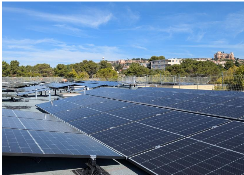
Groupe scolaire Martine Morin

Site rénové en service 1 309 m 2 – 280 kWc