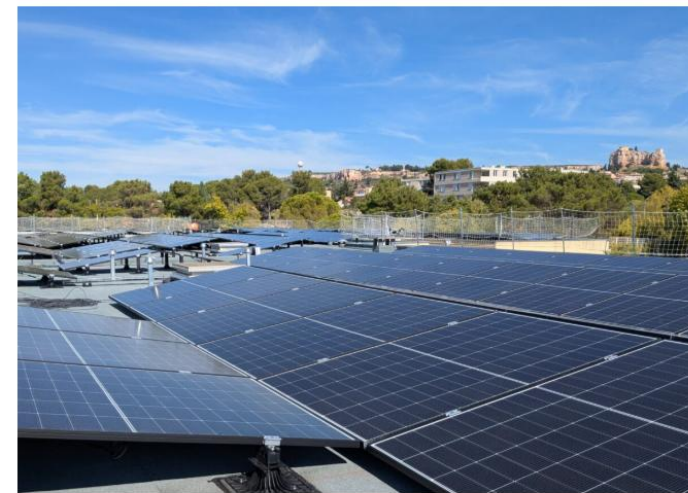
Solarisation du groupe scolaire Martine Morin.

AUTOCONSOMMATION INSTALLATIONS MARCHÉS ET STRATÉGIES PV EN TOITURE FRANCE